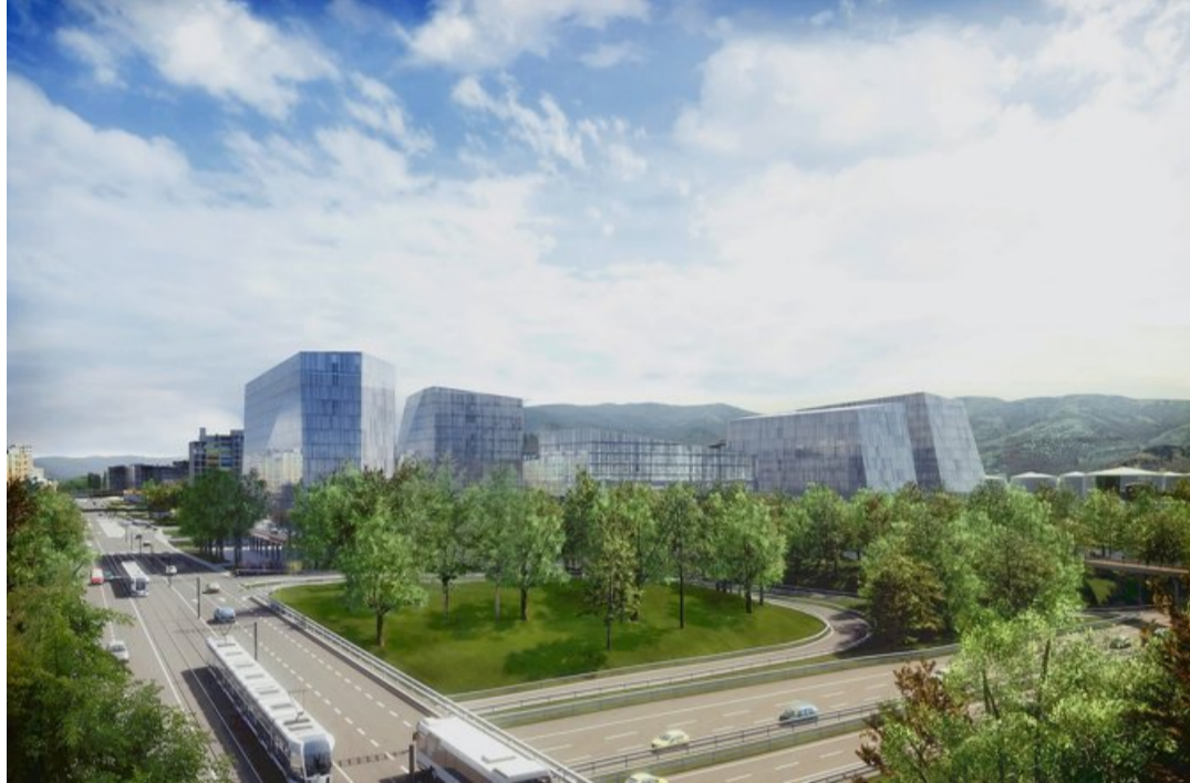
Vus de la route de Meyrin, les bâtiments d'activité de l'Étang, face à l'autoroute.

Chacun de ces hôtels aura un profil différent. La chaîne française B & B Hotels occupe le segment bon marché. Déjà très répandue en France, en Espagne et en Italie, elle a ouvert récemment